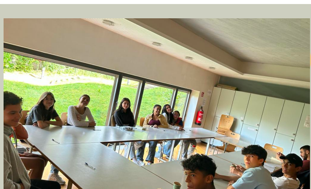
Reunión con el grupo juvenil