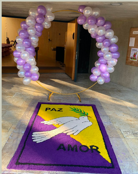
Fiesta del Señor de los Milagros