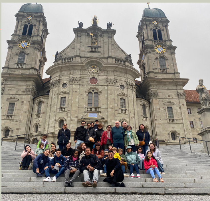
Peregrinaje a Einsiedeln